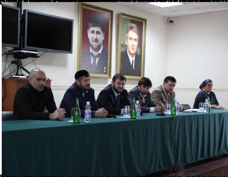
Встреча с представителями органов государственной власти. Планируется проведение семинара для адвокатов по правовому просвещению в СМИ»