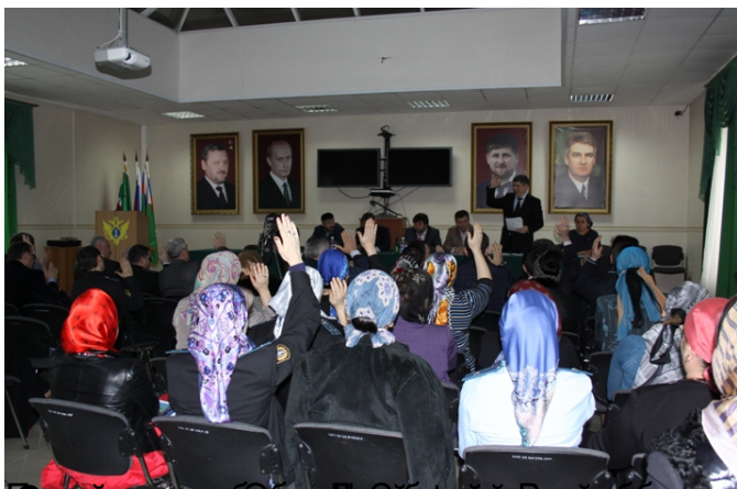
Встреча с представителями органов государственной власти

15.05.2013 05:49 - Обновлено 12.10.2015 08:02